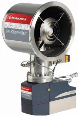
Bombas Criogénicas y Compresores