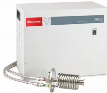
Cryochillers & Cryocoolers